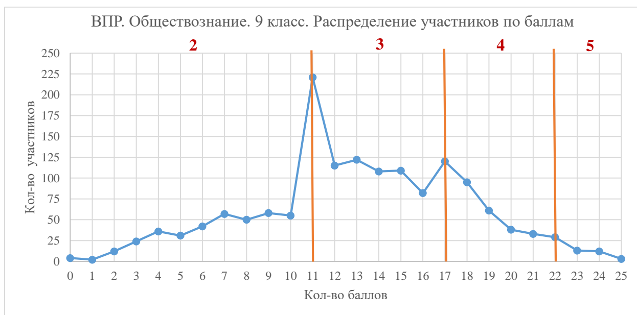
Диаграмма 6. Распределение участников по баллам

Наибольшее количество участников справились с работой на 11 баллов, которые являются нижней границей отметки «3», наименьшее количество участников набрали 1 балл.