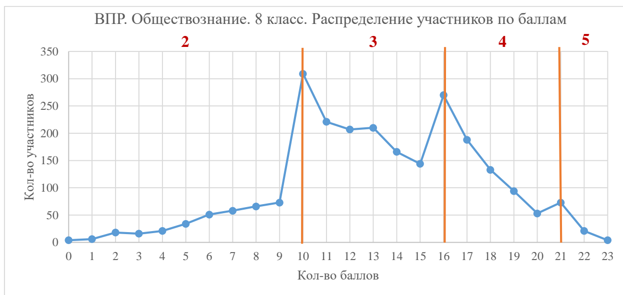
Диаграмма 4. Распределение участников по баллам

Наибольшее количество участников набрали 10 баллов, которые являются нижней границей отметки «3», наименьшее количество семиклассников справились с работой на 0 и на 23 балла.