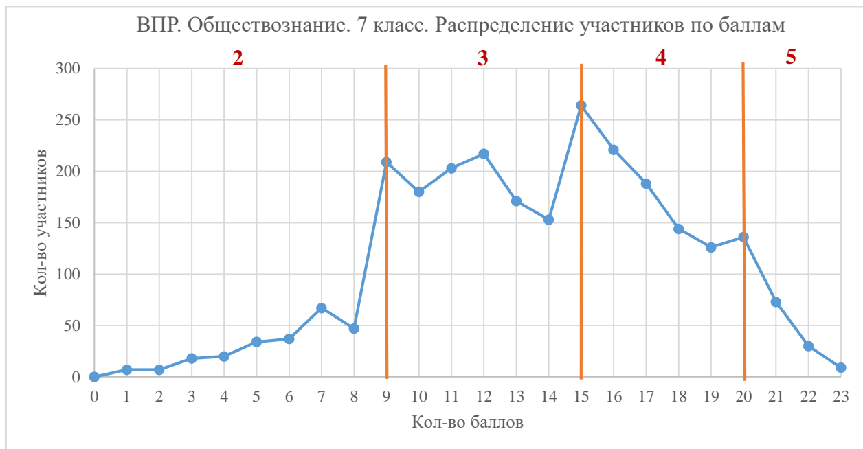
Диаграмма 2. Распределение участников по баллам

Наибольшее количество участников набрали 15 баллов, наименьшее – 0 баллов.