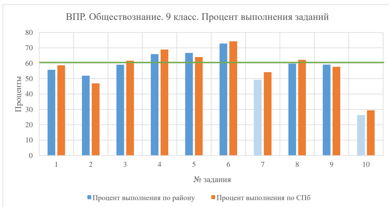
Диаграмма 5. Процент выполнения заданий

Успешнее всего (процент выполнения выше 60) учащиеся района справились с заданиями № 4, 5, 6. В 4 задании обучающиеся устанавливали соответствие между существенными чертами и признаками изученных социальных явлений, и обществоведческими терминами, и понятиями. Обучающиеся классифицировали объекты, самостоятельно выбирали основания и критерии для классификации. 6 задание предполагало выбор и запись нескольких правильных ответов из предложенного перечня ответов. И если в параллелях 7, 8 классов это задание вызывало трудности, то девятиклассники с ним справились лучше.