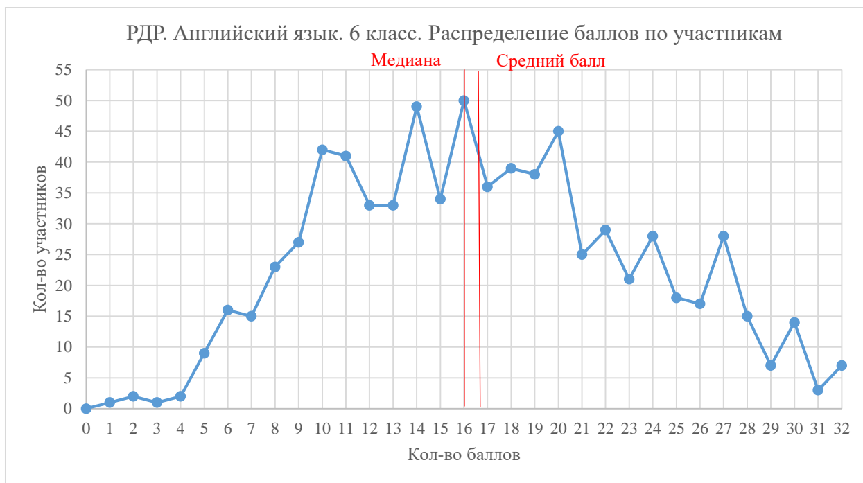
Диаграмма 2. Распределение участников РДР по полученным баллам

Средний балл, полученный за работу, составил 16,9, что говорит только о 50 % успешности выполнения заданий. Медиана – 16. Минимальный полученный балл в районе – 1, максимальный – 32.