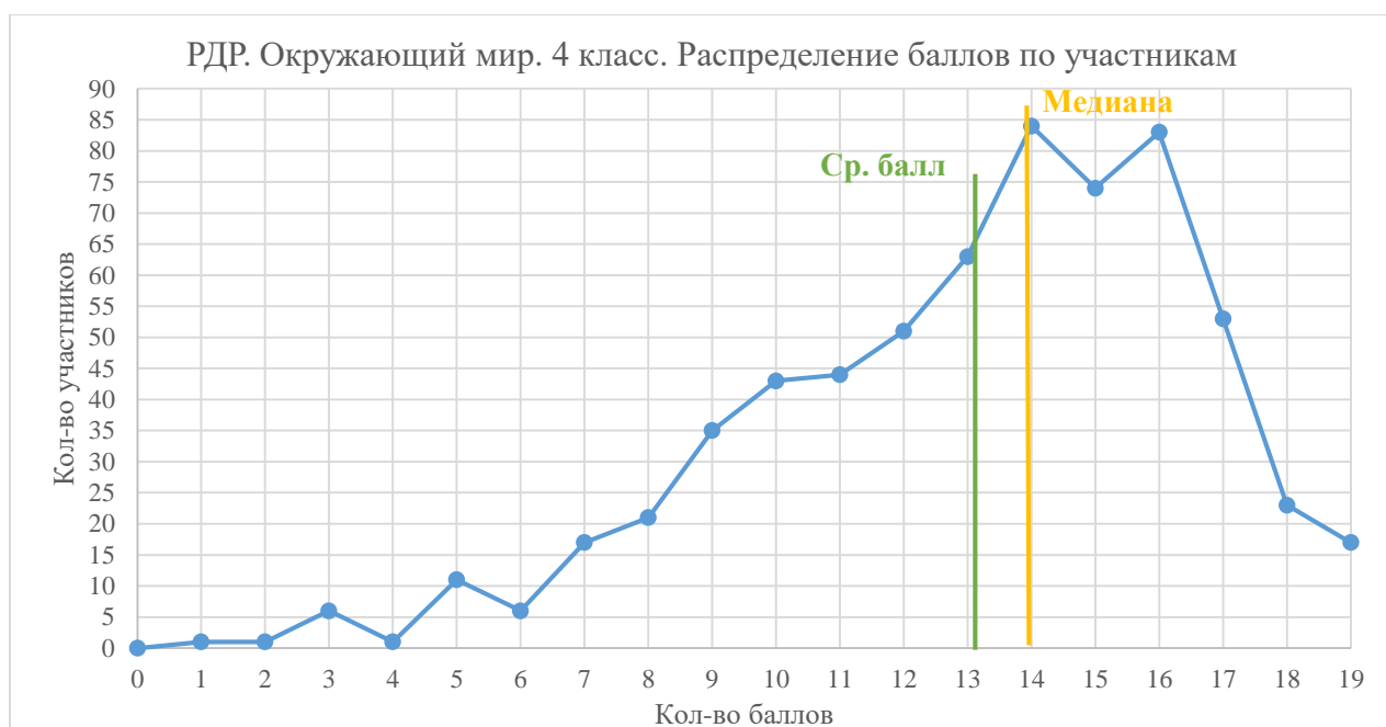
Диаграмма 6. Распределение баллов по участникам

Перевод первичных баллов в отметку выполнялся на основе шкалирования , представленного в таблице 6. Данная шкала была применима для школ, реализующих любую из программ, кроме программы «Начальная школа XXI века», в рамках которой одна из тем РДР ещё не была изучена обучающимися. Однако, в школах Фрунзенского района, участвовавших в РДР по окружающему миру, данная программа не реализуется.