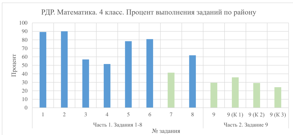
Диаграмма 3. Процент выполнения заданий по району

Процент выполнения заданий первой части РДР по математике варьируется в пределах от 41,36 % до 90,05 %.