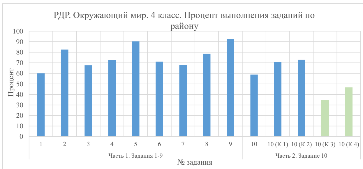
Диаграмма 5. Процент выполнения заданий по району

Работа содержала 10 заданий. Первая часть работы состояла из 7 заданий с выбором ответа и 2 заданий с кратким ответом. Процент выполнения каждого из заданий первой части от 60. Самые высокие результаты в районе установлены в заданиях № 5 (90,25 %) и № 9 (92,77 %). В обоих заданиях каждая из школ продемонстрировала результаты не менее 81,58 %.