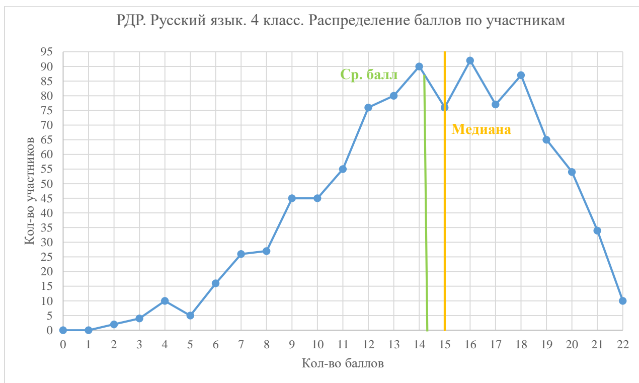
Диаграмма 2. Распределение баллов по участникам

Перевод первичных баллов в отметку выполнялся на основе шкалирования , представленного в таблице 2. Также в таблице указано распределение участников по полученным отметкам.