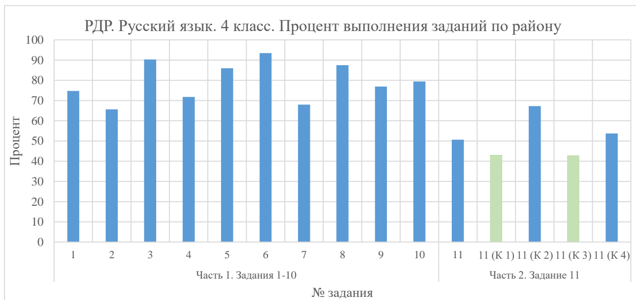
Диаграмма 1. Процент выполнения заданий по району

Работа по русскому языку состояла из 11 заданий. Первая часть работы содержала 9 заданий (№№ 2-10) с выбором ответа, одно задание (№ 1) – с кратким ответом. Процент выполнения заданий первой части во Фрунзенском районе варьируется в пределах от 65,64 % до 93,46 %.