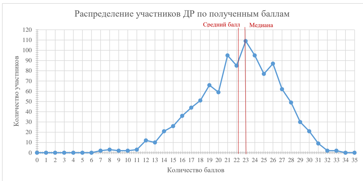
Диаграмма 2. Распределение участников ДР по полученным баллам

Перевод первичных баллов в отметку был выполнен на основании шкалирования, утвержденного в 2020 году в Санкт-Петербурге. В таблице ниже представлено сравнение региональной шкалы и шкалы, рекомендуемой на федеральном уровне.