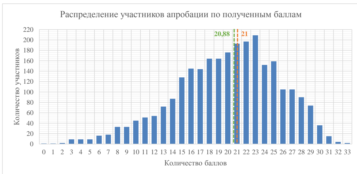
Диаграмма 2. Распределение участников апробации по полученным баллам

Перевод первичных баллов в отметку был выполнен на основании шкалирования, рекомендованного на федеральном уровне . Шкалирование, утвержденное в 2020 году в Санкт-Петербурге, полностью соответствует рекомендуемому.