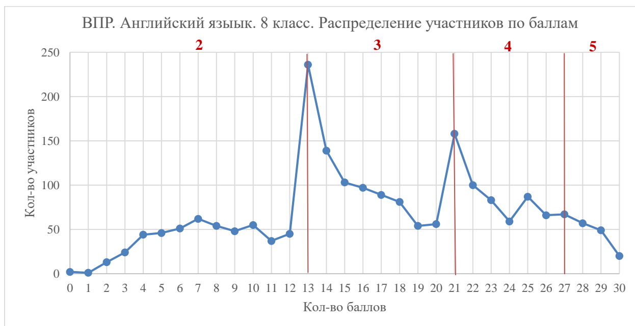
Диаграмма 2. Распределение участников по баллам

Наибольшее количество участников набрали 13 баллов – 11,3 %.