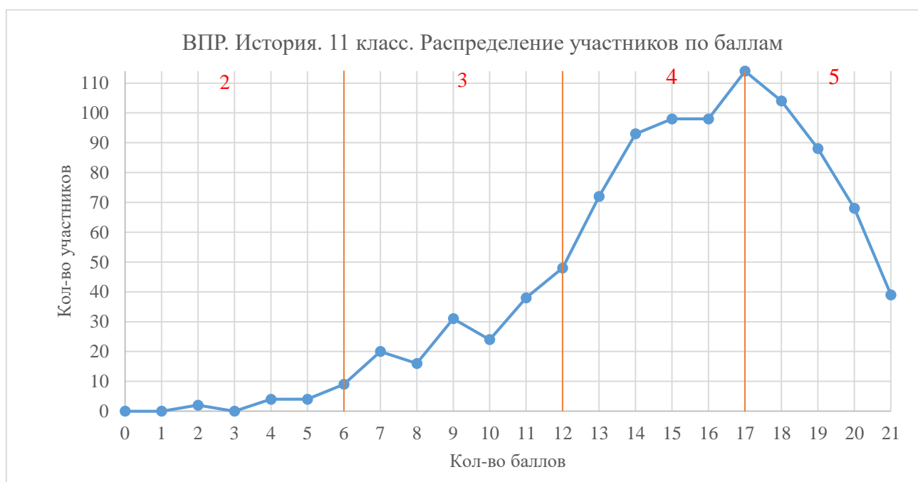
Диаграмма 6. Распределение участников по баллам

Максимально возможный балл за проверочную работу – 21. В базовом уровне сложности заданий максимальный балл составляет 16, в повышенном уровне сложности заданий максимальный балл составляет 5. Средний балл по Фрунзенскому району – 15,28, медиана – 16.