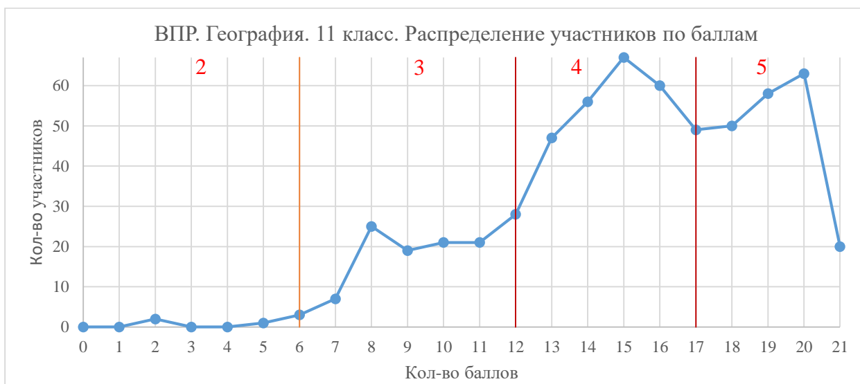
Диаграмма 4. Распределение участников по баллам

Перевод первичных баллов в отметку выполнялся на основании рекомендаций Федерального института педагогических измерений по переводу суммы первичных баллов за всероссийские проверочные работы в пятибалльную систему оценивания в 2022 году.