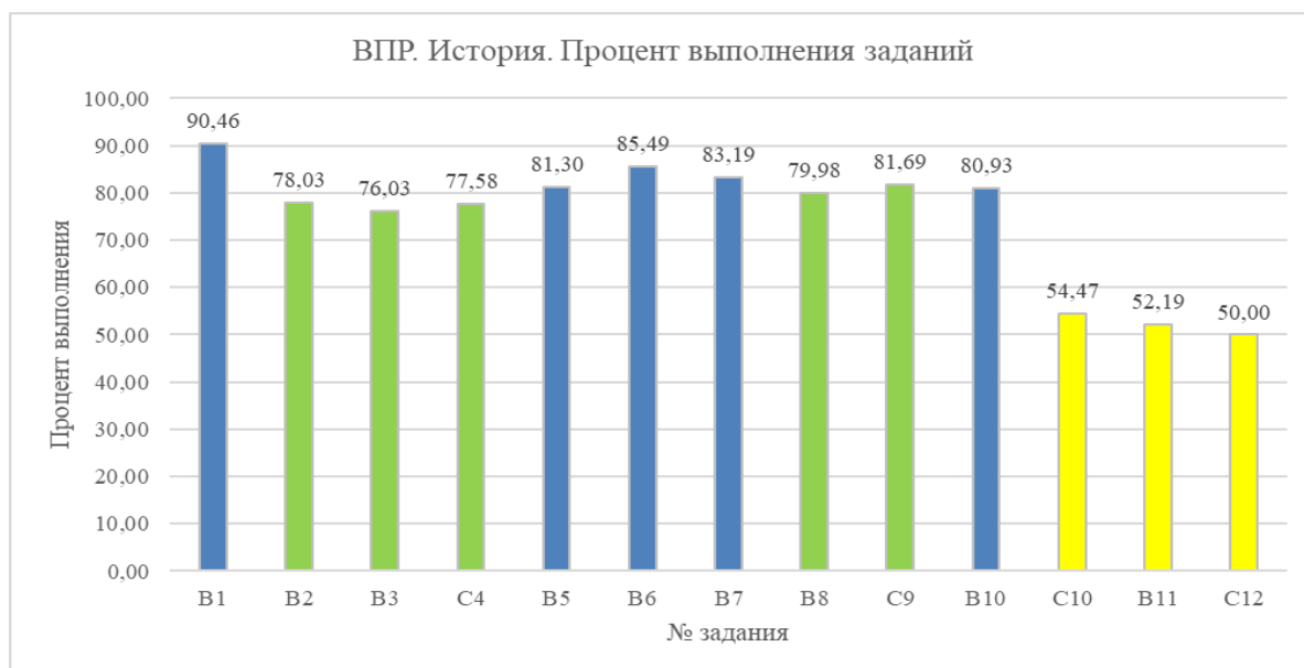
Диаграмма 5. Процент выполнения заданий

В заданиях проверялись знания основных фактов, процессов, явлений, терминов, персоналий, умение устанавливать причинно-следственные связи, умение проводить поиск исторической информации в письменных источниках, умение работать с иллюстративным материалом (знание фактов истории культуры), умение работать с исторической картой и знание истории родного края.