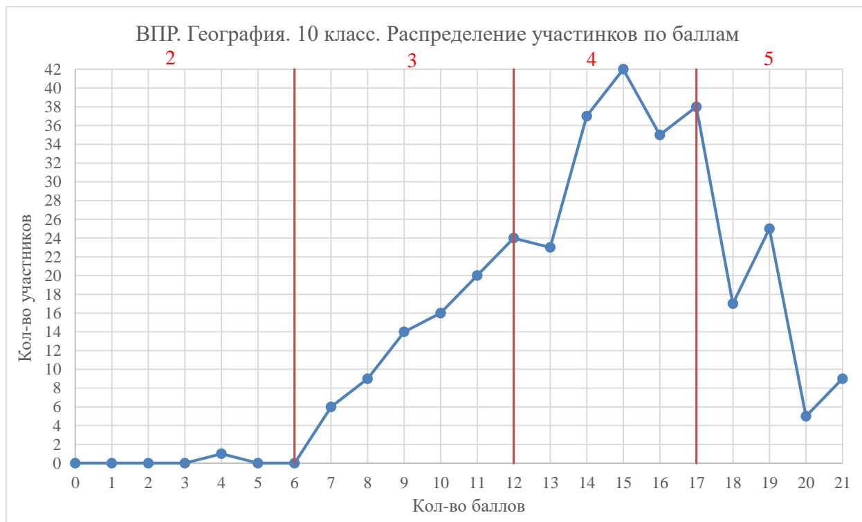
Диаграмма 2. Распределение участников по баллам

Перевод первичных баллов в отметку выполнялся на основании рекомендаций Федерального института педагогических измерений по переводу