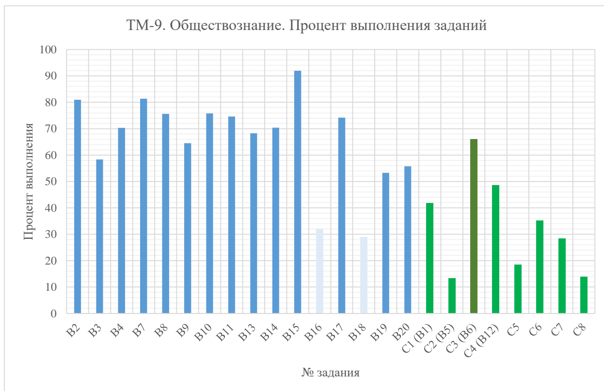
Диаграмма 1. Процент выполнения заданий ТМ-9 по обществознанию